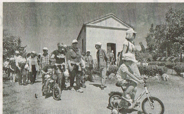
NOSEDO. Pellegrini alla chiesetta dei Santi Filippo e Giacomo

lano e in Europa». Promotori del progetto sono l'Associazione Nocetum, la cooperativa sociale La Strada, Vita Comunicazione, il consorzio Sir, l'Associazione Cascine e la cooperativa sociale Nocetum, col sostegno di Fondazione Cariplo e la collaborazione avviata da tempo con alcune università milanesi – Cattolica, Politecnico, Statale e Bocconi. Molteplici le azioni, già in corso o previste dal progetto. A partire dallo «studio storico culturale» per valorizzare la matrice rurale della valle (che sfocerà nel libro «Nutrire il territorio. Nuovi dialoghi metropolitani»), dal censimento dei beni patrimoniali e delle iniziative imprenditoriali dell'area (riscoprendo o tracciando nuovi percorsi di interconnessione), dalla realizzazione della cartografia e di una guida dei percorsi. In un territorio da scoprire a piedi o in bicicletta, il sogno è di tracciare un Cammino dei monaci fino a Corte Sant'Andrea, nel Lodigiano, e connettere la milanese Strada delle Abbazie con la Via Francigena. Nel